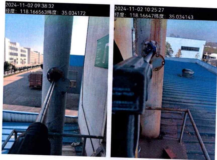
附图：临沂太合食品有限公司