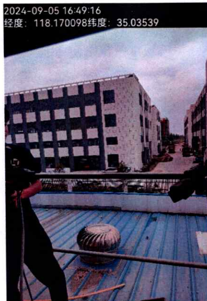
附图：（临沂太合食品有限公司）