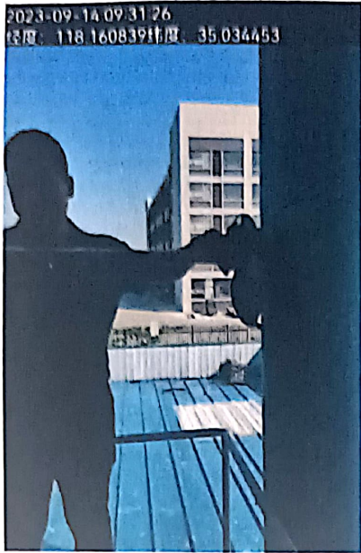
附图：临沂太合食品有限公司