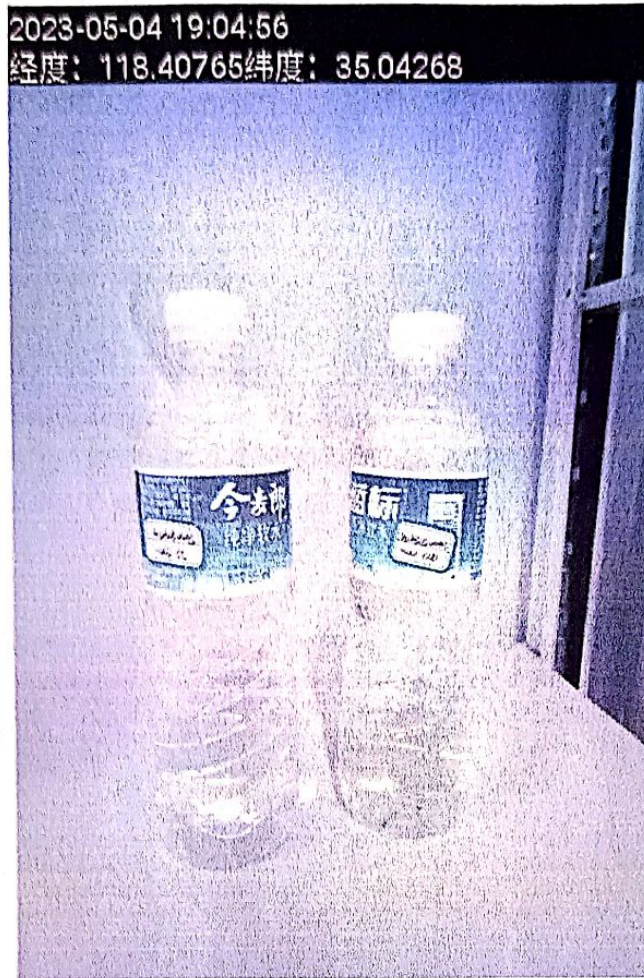
附图：（临沂太合食品有限公司雨水送样）