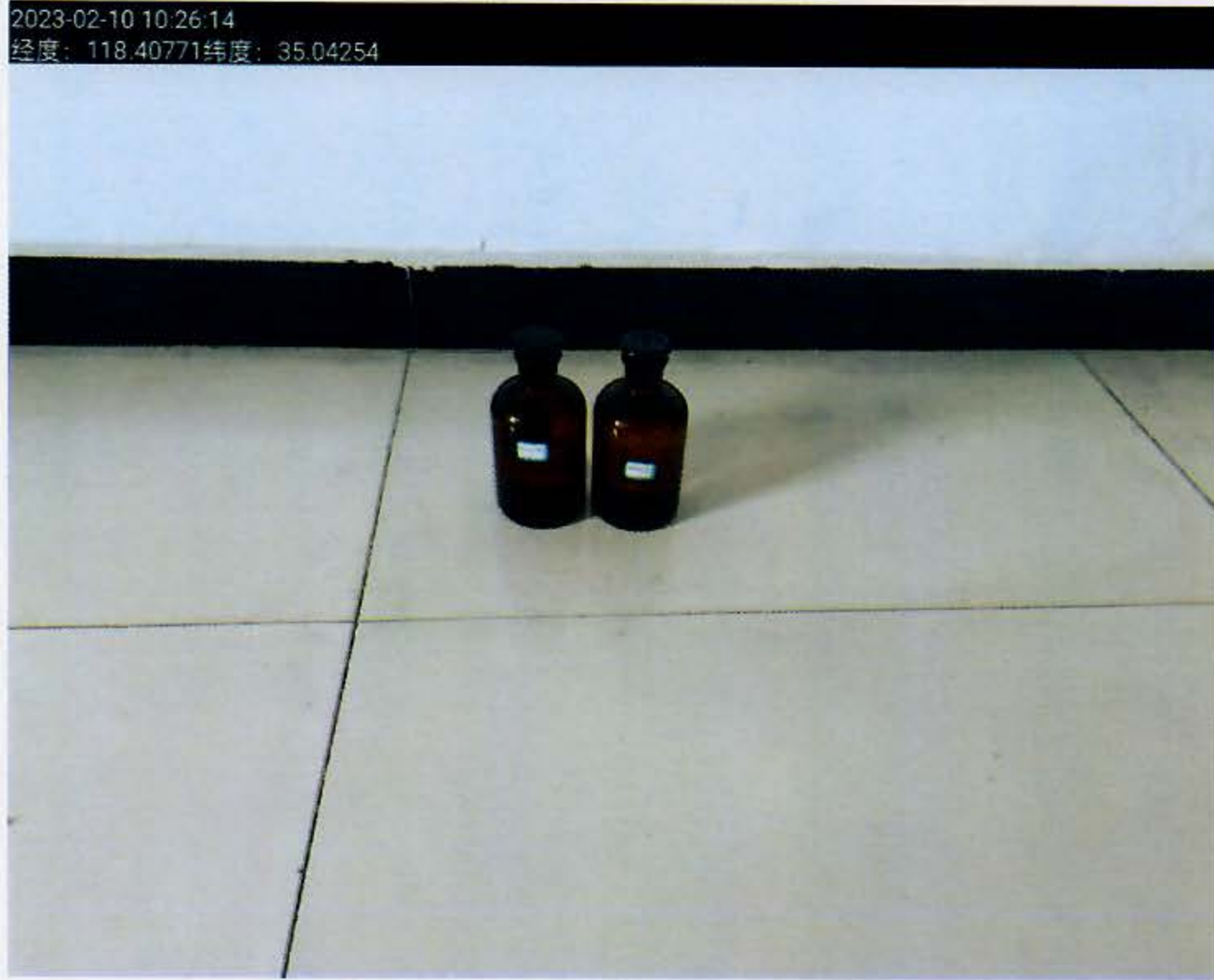
附图：（临沂太合食品有限公司）