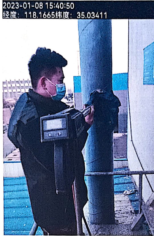
附图：临沂太合食品有限公司