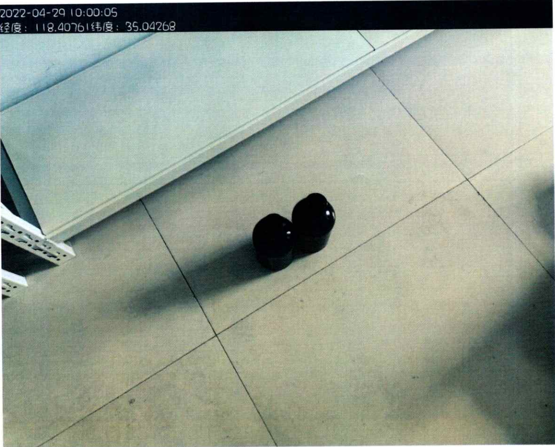
附图：（临沂太合食品有限公司）